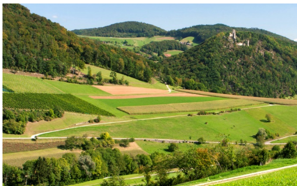
Breites, offenes Schenkenbergtal