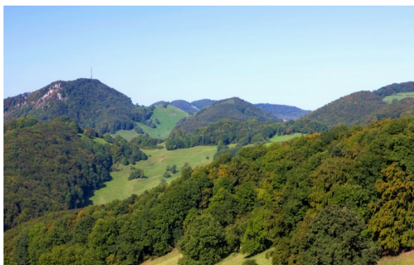
Mosaik aus Wäldern und Wiesen