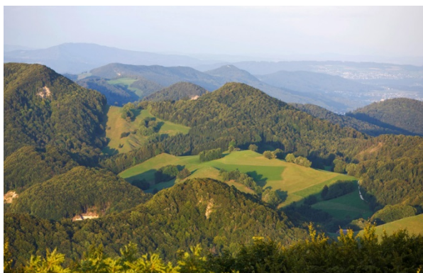
Blick über den Faltenjura